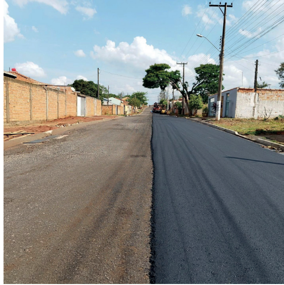
Ruas internas do Panorama em obras de pavimentação.